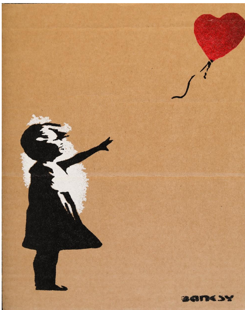
Banksy (Bristol, 1974?), Girl with balloon , Collezione d'Arte Fondazione Carit

FONDAZIONE CASSA DI RISPARMIO DI TERNI E NARNI