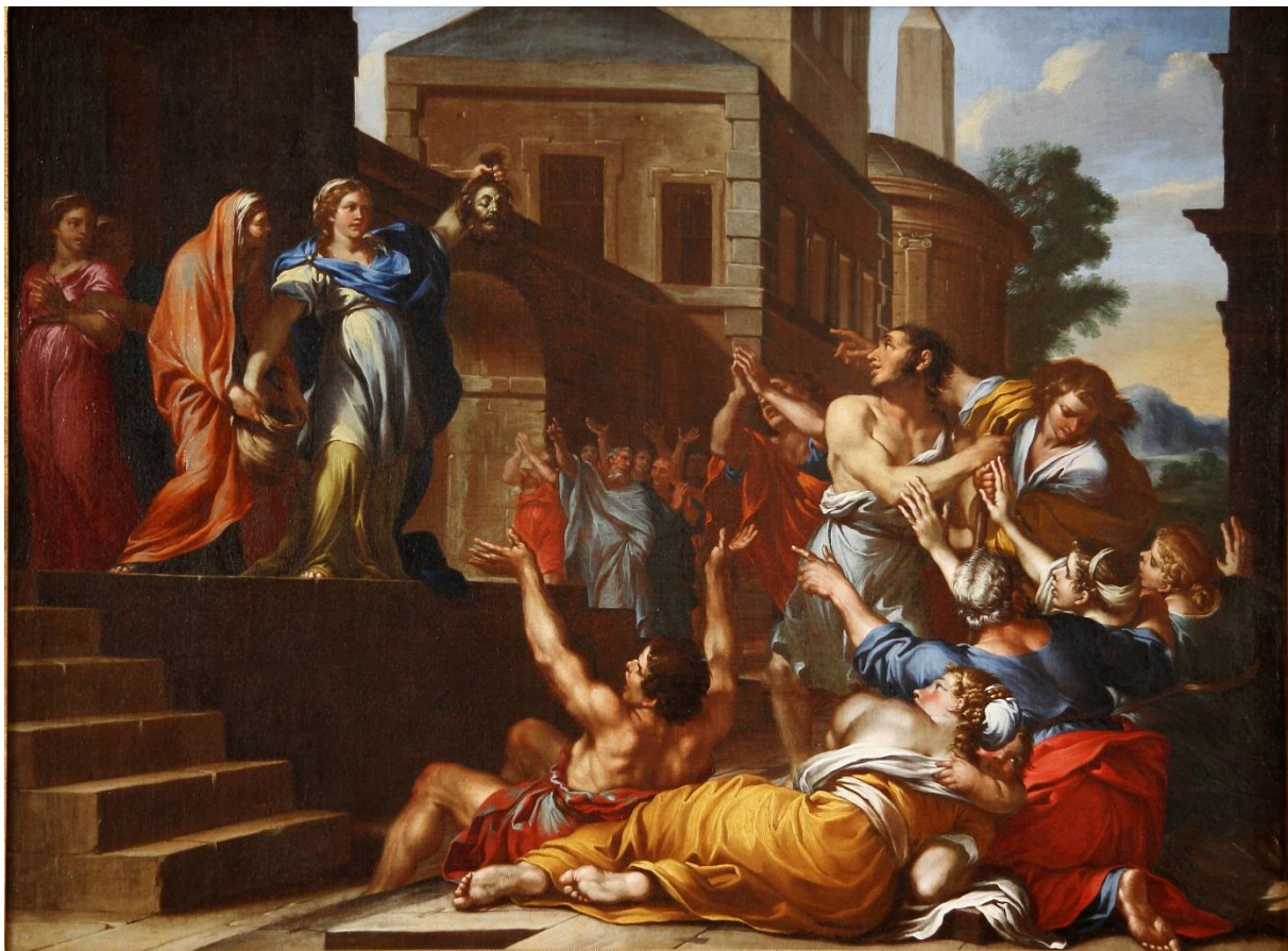
Girolamo Troppa (Rocchetta Sabina 1636 c.-dopo il 1706) (attr.), Giuditta mostra la testa di Oloferne ai Betuliani , dipinto ad olio su tela, Collezione d'Arte Fondazione Carit